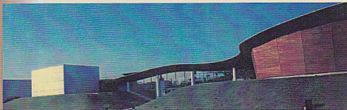
Mémorial de Caen