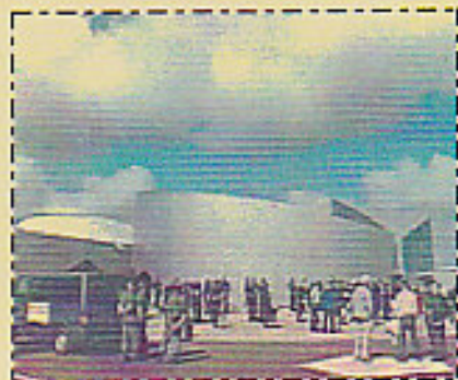
Centre de Juno Beach